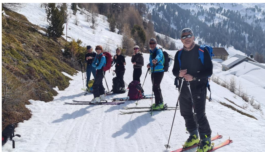
Samedi 2 Le Illohrn 2717m