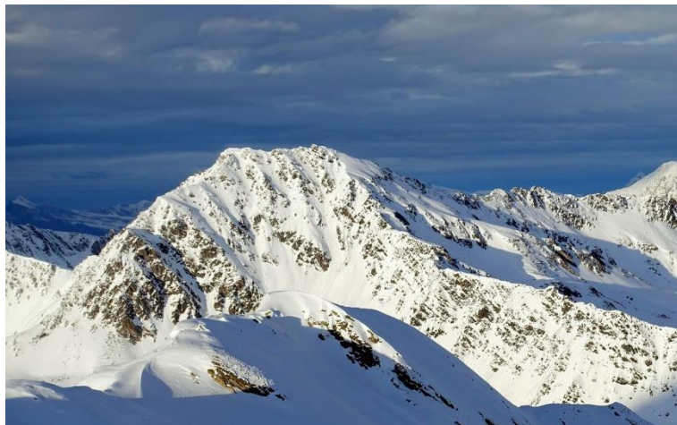
La Grande Chenalette